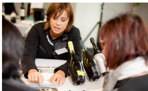
b2b personalizzati con operatori del settore turismo interessati ad includere la cantina nei propri itinerari e pacchetti