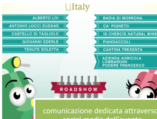
comunicazione dedicata attraverso i social media dell'evento

Tutte le cantine laziali accedono a tariffe promozionali, sia per i servizi personalizzati, sia per la partecipazione agli eventi di Wine and Travel Italy.